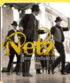
Netz Janos Produkció