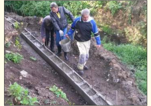
Árvízvédelmi fal építése a Madách utcában

gyesület részére a Belügyminisztériumtól a felújított Tatra tűzoltóautó mellett sikerült árvízvédelmi csomaggal felszerelt utánfutót is beszerezni, mely három különböző típusú szivattyúval segíti az önkéntesek munkáját.