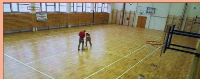
Felújításra került a tornaterem padlója is