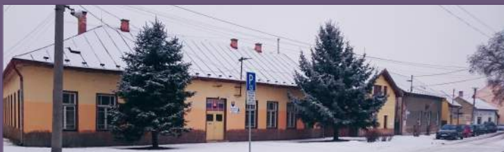
Már csak húsvéig működik ebben az épületben a Művészeti Alapiskola

Az önkormányzat a volt adóhivatal épületébe tervezi átköltöztetni a művészeti alapiskolát, melyet 2014-ben vásárolt meg a Szlovák Köztársaság Pénzügyi Igazgatóságától az épület általános értékének (227 ezer euró) 5 százalékáért, azaz 11 350 euróért. Az ingatlan azóta kihasználatlan volt. „Mivel az épület a múltban más célokat szolgált, részleges átalakításra van szükség. A biztonsági és higiéniai követelményeknek jelen állapotában nem felel meg” – mondta dr. Agócs Attila, a város polgármestere.