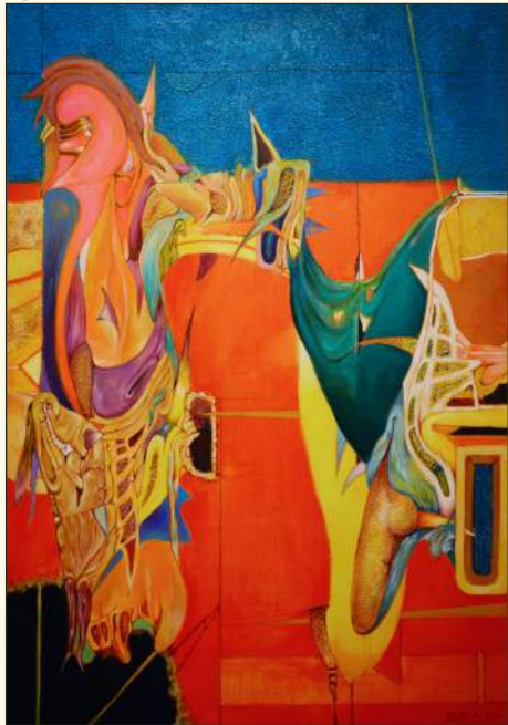
Sparta, 2015 – akril, vászon