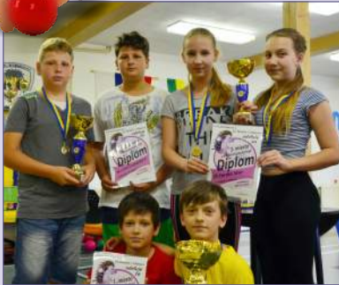
Csapatok versenye – serdülők