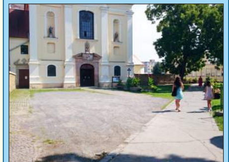
Priestor pred filakovským kostolom