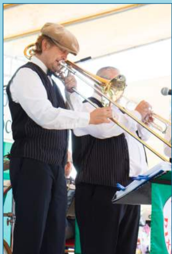
Koncerty živej hudby v mestskom parku – Prešovský dixieland