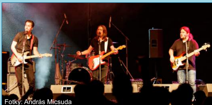
Fotky: András Micsuda