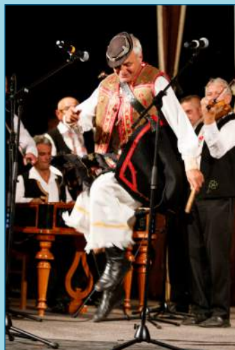
Umelecký program rodákov z Filákova