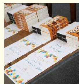
Az átadásra előkészített oklevelek és ajándékok