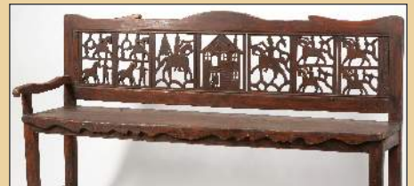
Áttört faragású lóca Ipolyvarbórol – a Néprajzi Múzeum gyűjteménye