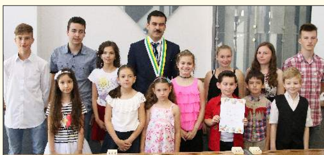
A II. Koháry István Alapiskola sikeres diákjai

bi diákot is arra szeretné ösztönözni, hogy tanulmányaikban legyenek szorgalmasak és sikeresek, mert a befektetett munka mindig meghozza gyümölcsét és a társadalom elismerését. Bár ezen sorok olvasása közben a diákok már bőven a szünidő felénél járnak, további kellemes, élményekben gazdag időtöltést kívánunk nekik, hogy szeptemberben frissen és megújult erővel kezdjék meg az új tanévet.