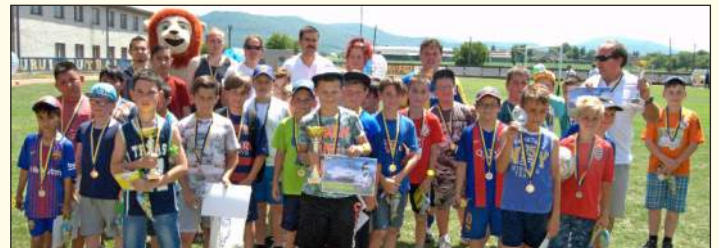
A Polgármester vándorseregletét zajló kispályás labdarúgótorna alapiskolás résztvevői

ajnácskői, feledi, fülekpüspöki és salgótarjáni sportalagutak is bekapcsolódtak a versenybe. A vándorseregletet a losonci LAFC Lučenec „öregfiúk” csapata nyerte el, megelőzve az FTC edzőcsapatát és az ajnácskői játékosokat. A második kispályás futballmérkőzést, amely szintén a Polgármester vándorseregletét zajlott, ebben az évben az általános iskolák alsó tagozatos tanulói számára rendezték, azzal a céllal, hogy a fiatalabb labdarúgó-rajongók is lehetőséget kapjanak. Mind a négy „elemi” képviseltette magát, amelyek a következő sorrendben végeztek: 1. helyezés – Iskola Utcai Alapiskola, 2. he-