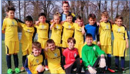
A lelkes utánpótlás

Legifjabb reményeink bajnoksága még nem versenyszerűen zajlik. A mérkőzéseknek motivációs jellege van, nem vezetnek hivatalos táblázatot, az eredmény és a helyezés az ő esetükben