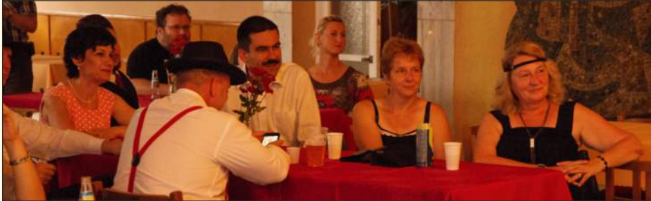
A szigethalmi delegáció a füleki VMK swing táncestjén