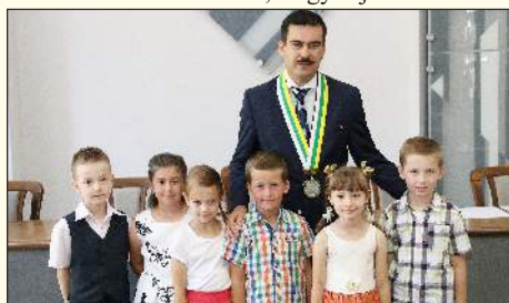
Sikeres ovisok a Stúr Utcai Óvodából

get téve. A meghívott tanulók listáját az iskolai intézmények igazgatóinak és tanáraik ajánlása alapján állítják össze, figyelembe véve, mely diákok képviselték eredményesen az iskolát – és egyben a várost is – különféle megmérettetéseken, fesztiválokon, versenyeken vagy diákolimpiákon. A június 27-én megtartott rendezvényen a kijelölt diákok Agócs Attila polgármester úrtól nemcsak oklevelet, tárgyi ajándékot és é-