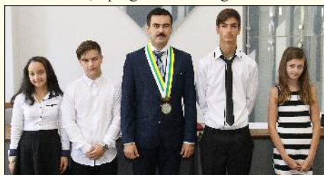
A Mocsáry Lajos Alapiskola sikeres diákjai

Már-már hagyománnyá vált Füleken, hogy az iskolai tanév végén több tucat füleki diák látogat a Városházára, a polgármester meghívásának ele-