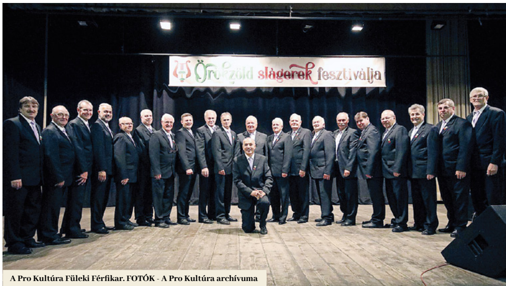
A Pro Kultúra Füleki Férfikar.