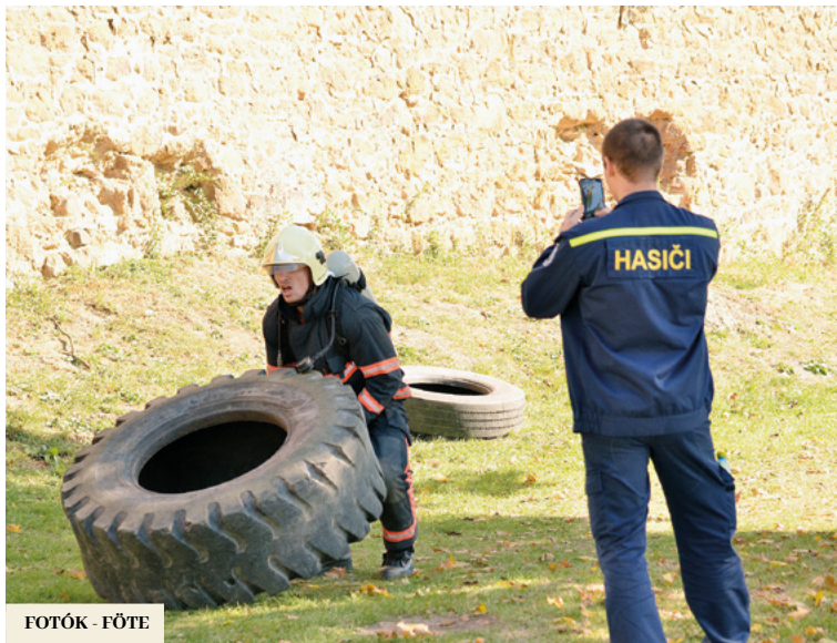
FOTÓK - FÖTE