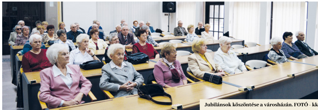
Jubilánsok köszöntése a városházán.