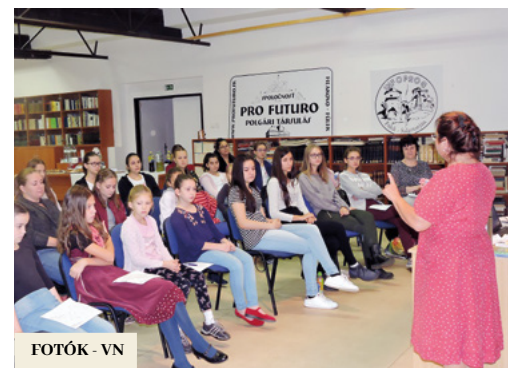
FOTÓK - VN