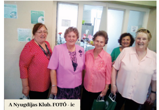
A Nyugdijas Klub. FOTÓ - ic