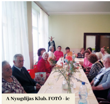
A Nyugdijas Klub.