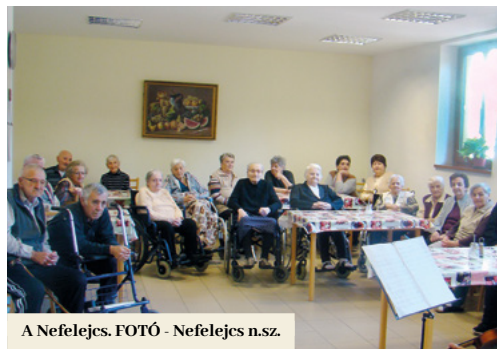
A Nefelejcs.