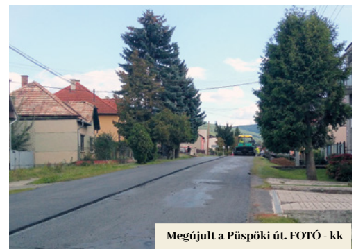
Megújult a Püspöki út. FOTÓ - kk