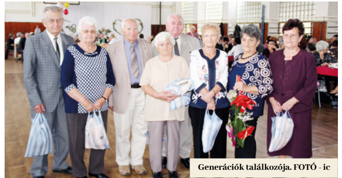
Generációk találkozója.

A z október már hosszú évek óta az idősek iránti tisztelet hónapja, így ebben az időszakban több időseknek szóló rendezvény is megvalósul. Füleken már hagyományosan megünnepeljük a jubilánsokat is, méghozzá többszörösen!