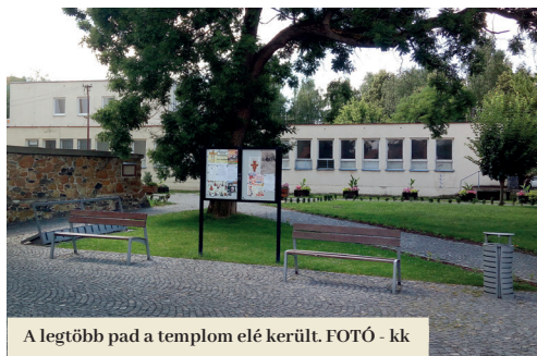
A legtöbb pad a templom elé került.