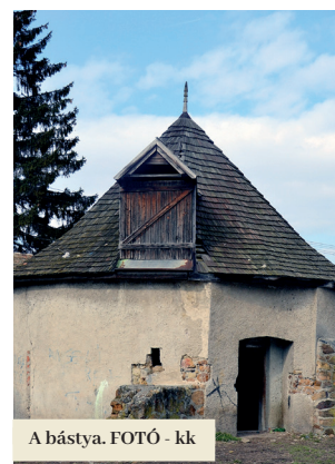
A bástya.

lan volt, illegális személerakatok voltak benne, és az állaga fokozatosan romlott. A polgármester szerint a projektnek köszönhetően a jövőben az ilyen jelenségek megelőzhetőek lesznek. „Azzal számolunk, hogy a beruházásunkat követően ebben a városrészben további magánvállalkozások indulnak. Bizunk benne, hogy visszatér az élet a város ezen részébe, és ezáltal Füleken újabb funkcionális urbanisztikai térelemmel bővül” – fejezte be mondandóját.