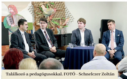
Találkozó a pedagógusokkal.