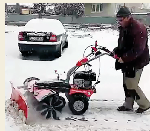
FOTÓ - A Közhasznú Szolgáltatások