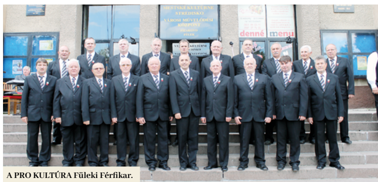
A PRO KULTÚRA Füleki Férfikar.

Tisztelettel a PRO KULTÚRA Füleki Férfikar elnöksége