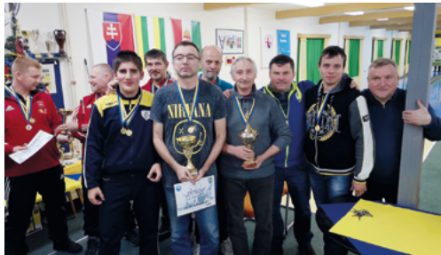
FTC Tekeosztály A csoport.

Január elején a füleki FTC tekepályáján zajlott a huszonötödik évfolyamába lépett Újrési teke-torna a polgármesterkupáért. A versenyen hozzávetőleg százan vettek részt Szlovákiából és a szomszédos Magyarországról. A nagy érdeklődésre való tekintettel a mérkőzések négy napon keresztül zajlottak, január másodikától ötödikéig. Ahogy a bajnokság előző évfolyamaiban, úgy az idén sem maradtak szégyenben a füleki tekések, akik kiemelkedő eredményeket értek el. Az FTC A csoportja az összesítésben első helyezést ért el.