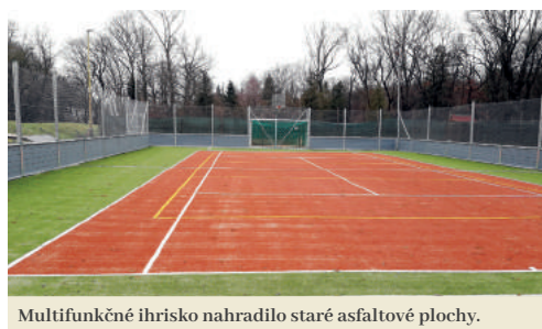
Multifunkčné ihrisko nahradilo staré asfaltové plochy.