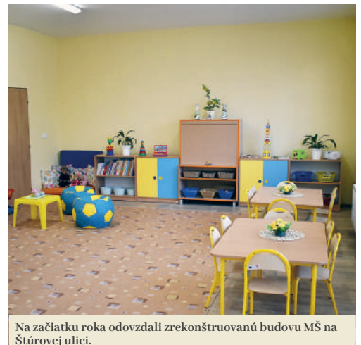
Na začiatku roka odovzdali zrekonštruovanú budovu MŠ na Štúrovej ulici.