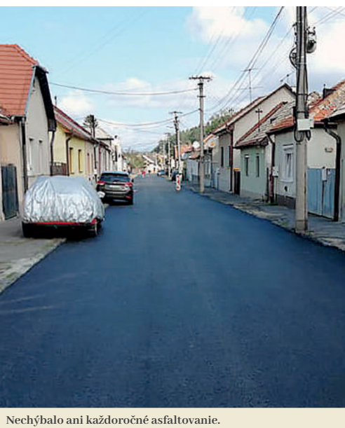
Nechýbalo ani každoročné asfaltovanie.