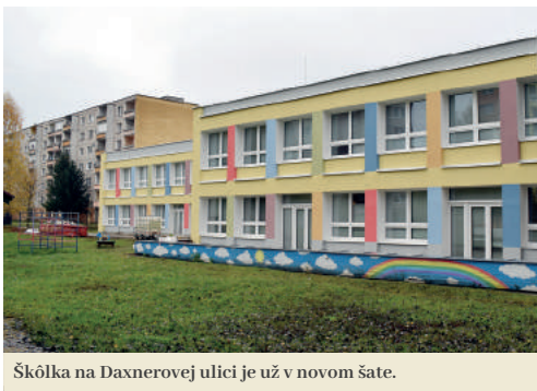
Škôlka na Daxnerovej ulici je už v novom šate.