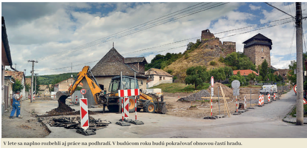
V lete sa naplno rozbegli aj práce na podhradi. V budúcom roku budú pokračovať obnovou častí hradu.