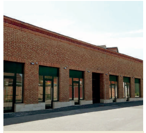
Na Trhovej ulici vyrástla nová mestská tržnica.