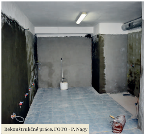
Rekonštrukčné práce.