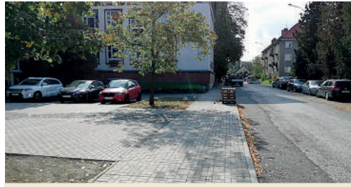
Revitalizáciu prešiel aj priestor pred ZŠ na Školskej ulici.