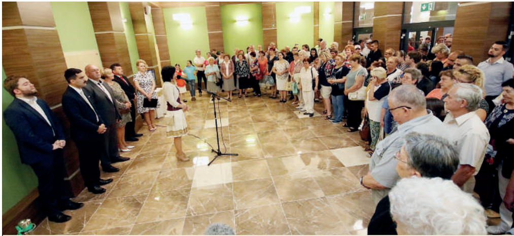
Azda najočakávanejším bol projekt rekonštrukcie budovy MšKS. Obnovu prešiel celý interiér vrátane inštalácií.