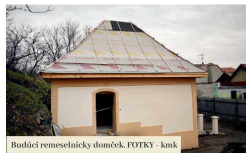
Budúci remeselnícky domček.

Návštevníkom priblížia výsledky archeologických výskumov na hrade.