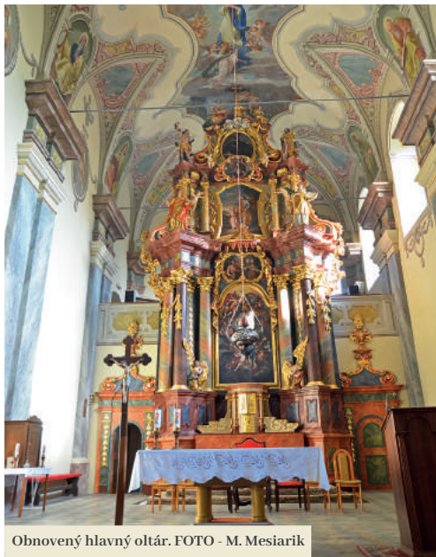
Obnovený hlavný oltár.

O reštaurovaní výmalby filakovského kostola