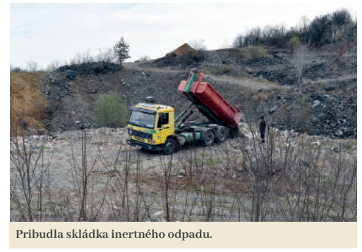
Pribudla skládka inertného odpadu.