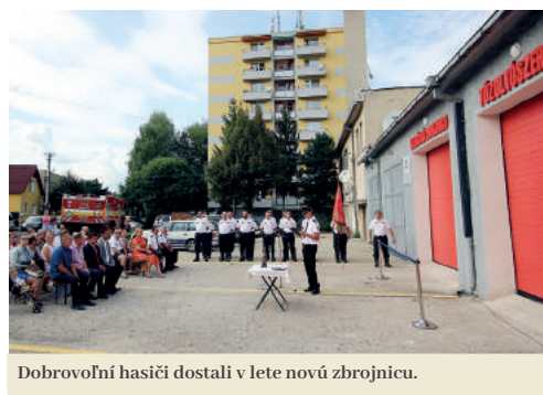
Dobrovoľní hasiči dostali v lete novú zbrojnicu.