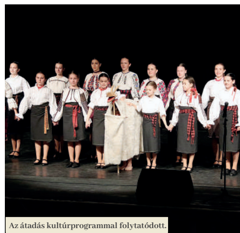
Az átadás kultúrprogrammal folytatódott.