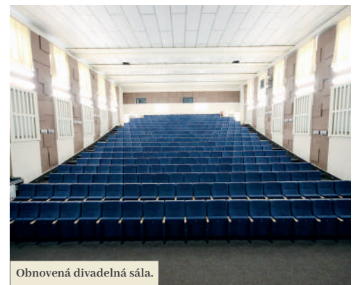
Obnovená divadelná sála.