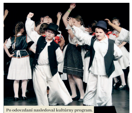
Po odovzdaní nasledoval kultúrny program.