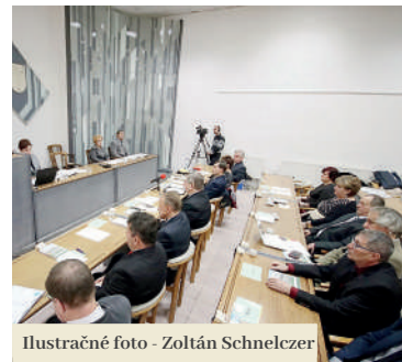
Ilustračné foto - Zoltán Schnelczler

Nasledoval bod predkladania hodnotiacich správ. Prvou z nich bola správa o plnení programového rozpočtu za rok 2018. Z neho vyplynulo, že hospodárenie mesta bolo prebytkové (na základe upraveného rozpočtu), nakoľko príjmy malo vo výške vyše 12 miliónov eur a výdavky vo výške vyše 11 miliónov eur. Prebytok tak predstavuje sumu vyše 862-tisíc eur. Po odpočítaní nevyčerpaných účelovo určených prostriedkov zo štátneho rozpočtu z nich popuťuje do rezervného fondu vyše 46-tisíc eur. Hodnotiace správy následne predniesli aj riaditeľky Hradného múzea