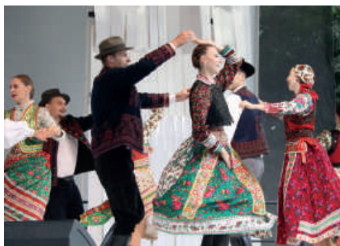
A folklor a város kulturális rendezvényeinek hagyományos eleme. FOTÓK - Schnelzer Zoltán, Szvorák Emese, szöveg - kmk

A városvezetés a járványügyi helyzet miatt a jubileumi XXX. Palóc Napok megrendezését a következő évre halasztotta. Helyette Kulturális napokat tartottak. A többnapos, ám kisebb volűmenű programok iránti érdeklődés felűlűműlta a várakozásokat.