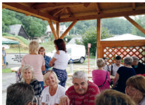
A Pincesor PT ismét borkóstolót és pincemustrát rendezett, melyre több tíz érdeklődő ellátogatott.