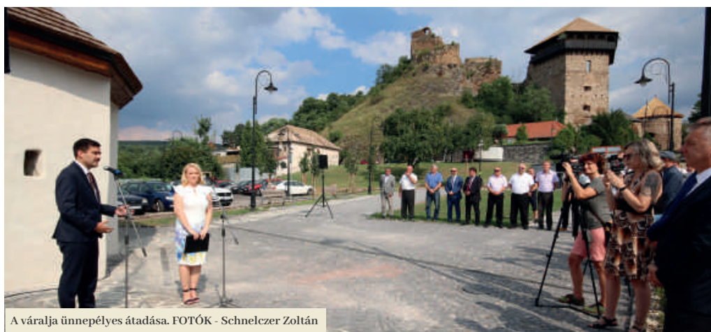
A váralja ünnepélyes átadása.

Ötéves projekt zárult Füleken. Augusztus 14-én a városi ünnepségsorozaton belül hivatalosan is átadásra került a revitalizált váralja. A széleskörű INTERREG határon átnyúló projektnek köszönhetően csaknem egymillió euró érkezett a városba.