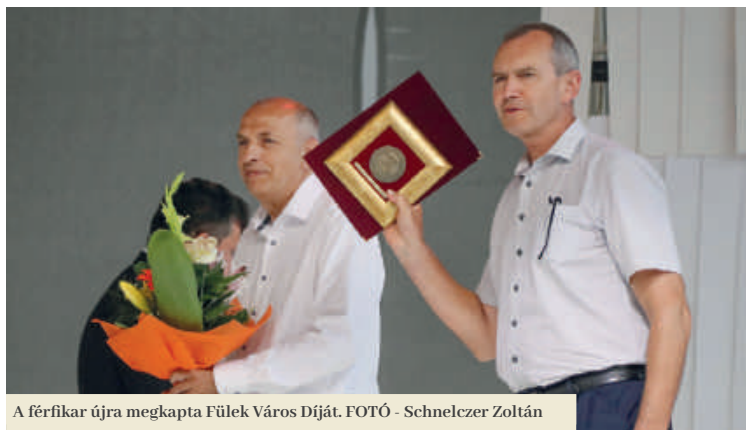
A férfikar újra megkapta Füleki Város Díját.

lekiek is többet megtudjanak a kóruséneklés múltjáról és jelenéről a városban. Mi mindent terveznek megvalósítani a jubileumi évben, hogyan ünnepli a kórus a 100. évfordulót?