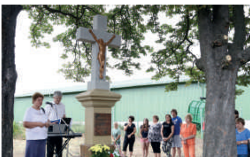
Szombatban ünnepélyesen felszentelték a Rátki-dombon található keresztet, melyet a megrongálása után a város és a plébánia közösen újított fel.