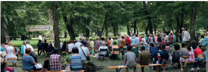
Muzsikál az erdő. Július: Komolyzenei hangverseny harmonika-, zongora-, gitár- és gordonkajátékkal, valamint a Pro Kultúra Férfikkal. Népi dallamok a Foncsik Énekegyüttestől, a File Bandától és a Jánošík Gyermek-néptáncgyűttes énekesitől. Kísérőprogram: ismeretterjesztő előadások, kézműves foglalkozások, játszóház, mesemondás, bábszínház.