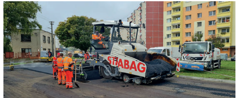
Október-november: Utak és parkoló Noha az aszfaltozás költségvetését a koronavírus miatt csökkenteni kellett, októberben a város ennek ellenére megjavította a Šverma és Jilemnický utcák burkolatát, átfogóan rekonstruálta a Hviezdoslav utcát és a Közhasznú Szolgáltatások (VPS) épülete előtti poros út egy szakaszát. Ugyanitt új parkolóhelyeket is létrehozottak.