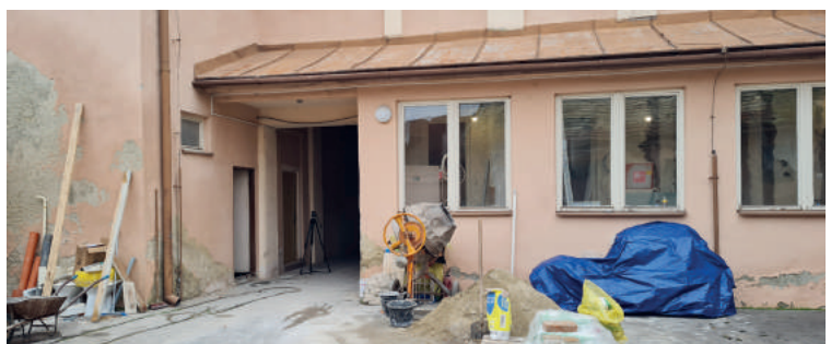
November: Felújítási munkálatok a Városi Hivatalban Az év végén az önkormányzatnak sikerült elvégeznie a városháza épületében található szociális helyiségek rekonstrukciójának harmadik fázisát is. A Pénzügyminisztérium támogatásának köszönhetően helyreállították a toalettet és a közös építészeti hivatalnál lévő összekötő folyosót.