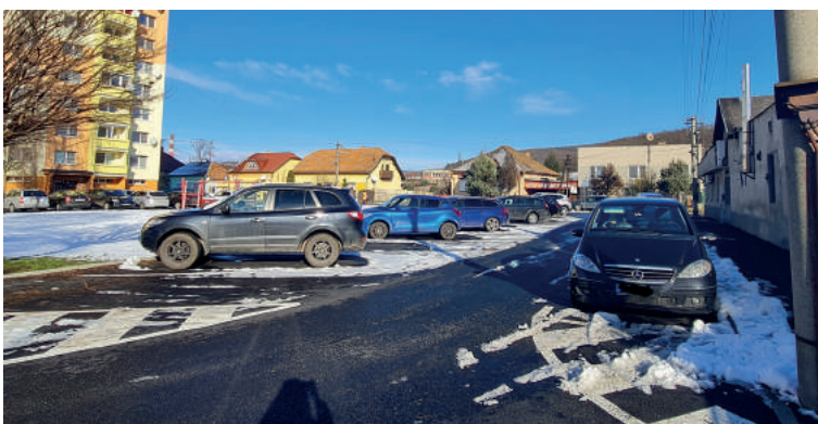
A paprét parkoló.