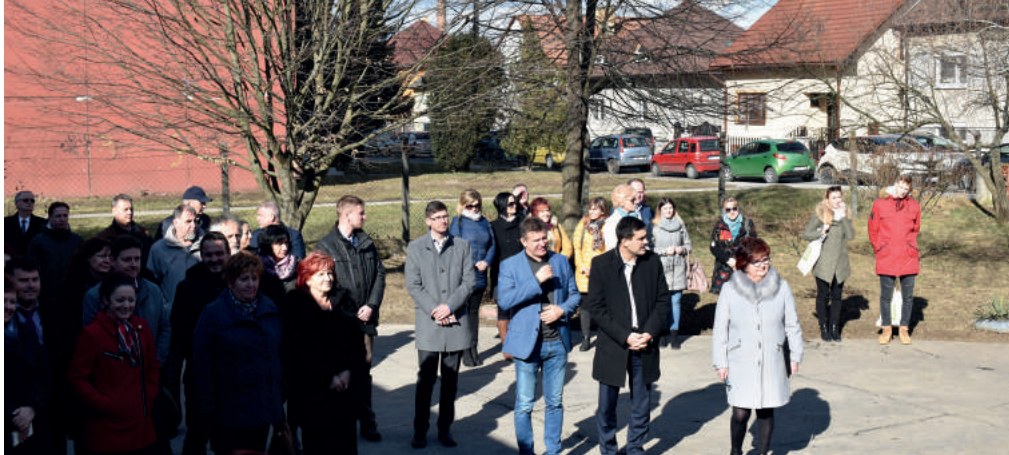
Február: A Daxner utcai Óvoda átadása Február 20-án a város átadta a gyerekeknek a felújított óvoda épületét a Daxner utcában. A felújítási munkálatok 2016 óta, három fázisban zajlottak.

Bár a 2020-as évet a világvárvány és annak gazdasági következményei jellemezték, városunk életében mégis sikerült több fejlesztést is véghez vinni. Több éve tartó projektek fejeződtek be, valamint beruházások történtek a kultúrába, sportba, infrastruktúrába és szabadidős tevékenységekbe is. A beruházások túlnyomó többségéhez a városnak sikerült támogatást szereznie. kmk, ford.: kp