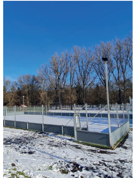
Január: Multifunkciós sportpálya Január 21-én hivatalosan átadták a gimnázium mögötti multifunkciós sportpályát, amelyet azóta a gimnazisták, az FTC futballistái és a nagyközönség is használ.