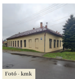
Fotó - kmk

Korszerűsítik az elektromos hálózatot, a melléképítmények felszerelését, valamint a központi fűtőrendszer hővisszanyerős szellőztető rendszerrel. A múltban a város megette a szükséges intézkedéseket a falak nedvesedése ellen is. A belső terek rekonstrukciója után az otthonban nem fog hiányozni a közösségi helyiség, a konyha, de a pihenőszoba sem. Új járdát is építenek a bejáratához. A munkálatok előreláthatólag ez év júliusáig befejeződnek.