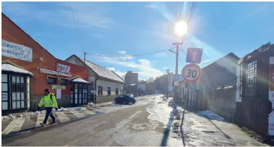
Július: Piac utca Az utca a közelmúltban helyet adott a rendszeres szabadtéri piacoknak, ám a fedett városi piac megépítése után kihasználatlan maradt. A Piac utcát ezért egyirányúsították és megnyitották az autók számára, valamint új parkolóhelyeket is kialakítottak.