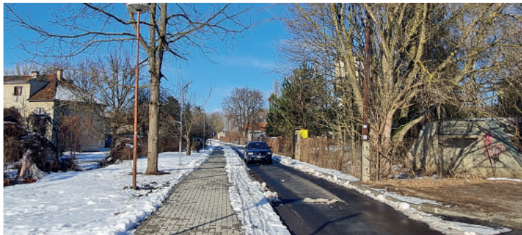
Október: Kerékpárút Októberben a vasútállomás mellett is teljes mértékben megkezdődtek az építési munkálatok. A város megépítette a kerékpárút első részét, amely végül összekapcsolja majd az állomást az ipari zónával.