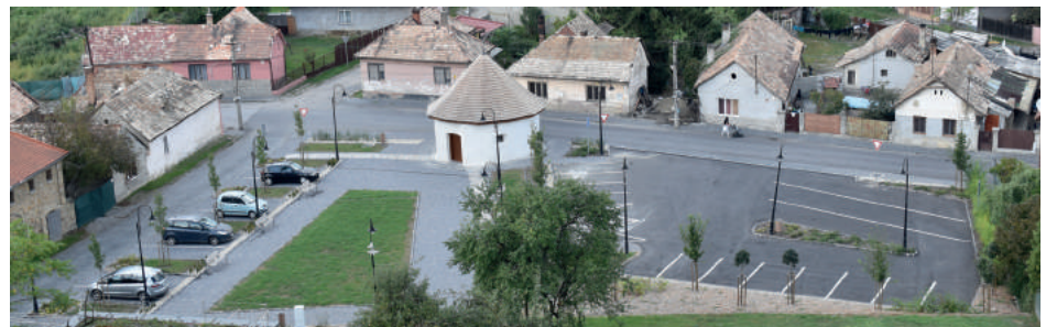
Augusztus: A váralja átadása Az utóbbi évtizedek legnagyobb városi projektjét – a váralja csaknem egymilli eurós revitalizálását – az önkormányzat augusztusban fejezte be a felújított terület hivatalos átadásával. Parkolóhelyeket, nyilvános mosdókat hoztak létre, megújult a városi erődtámasztó bástya és a borház, az ágyúbástya fölé tető került, és sok minden más is megváltozott. A projekt nagy előrelépést jelent a nemzeti kulturális emlékek helyreállításában.