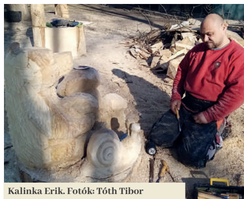
Kalinka Erik.

föld- és építési munkákhoz elengedhetetlen fakivágást és gyomborokirtást.