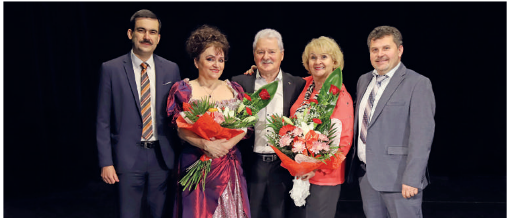
Majdnem kétszáz füleki időskorú találkozott a nőnap alkalmából megrendezett ünnepi műsoron.

A rendezvény elején Agócs Attila a város polgármestere szólott, legfőképpen a jelenlévő hölgyekhez, és hangsúlyozta a nők fontos szerepét a társadalomban. A három vendég előadásában magyar és szlovák nyelven elhangzott, jól ismert dalok, slágerek, operettek, sőt a leg híresebb operaáriák sokasága nem egy hölgyet és urat dalra fakasztott a közönség soraiban. A nagyszerű műsor után, hazainduláskor mindkét nyugdíjas szervezet megajándékozta a hölgyeket az elmaradhatatlan szegfűvel. A teljes elégedettséghez már csak az hiányzott, hogy ezt követően a bálteremben együtt ünnepelje-