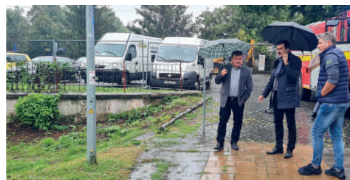
Az építési területet átadták a kivitelezőnek.