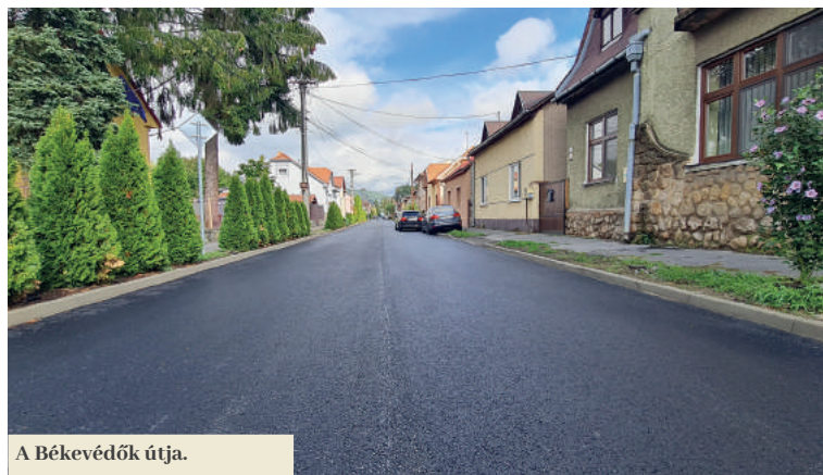
A Békevédők útja.