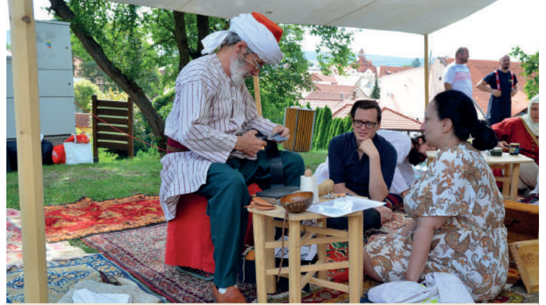
A Hungari Dzsbedzsi történelmi csoportnak köszönhetően az érdeklődők betekintést nyerhettek a török hétköznapokba a 16. és 17. században.