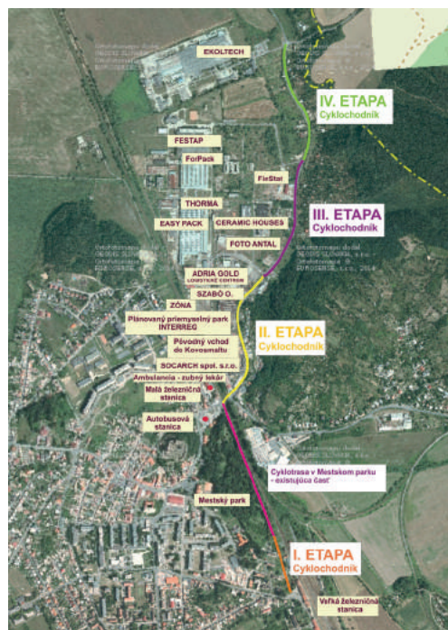
A kerékpárút tervezett szakaszai.