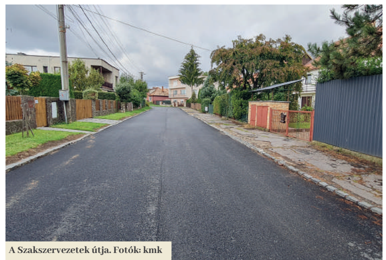
A Szakszervezetek útja.