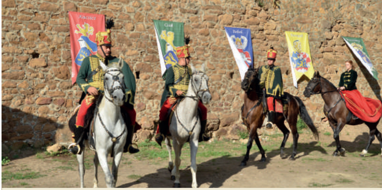
A rendezvényen fellépő történelmi csoportok repertoárjában viselet-, fegyverzet-, zene- és táncművelés-bemutatókat láthatott a közönség. A látogatókat különféle felszerelések, egyenruhák, katonai gyakorlatok várták, és megnézhették, hogyan képezték ki hajdanán a magyar elit lovasság, a huszárok lovait (Gömöri Lovas és Népi Hagyományőrző Egyesület).