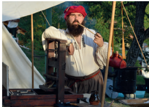
A Defensores történelmi csoport gasztronómiai specialitásokkal kedveskedett a különleges ízek kedvelőinek.