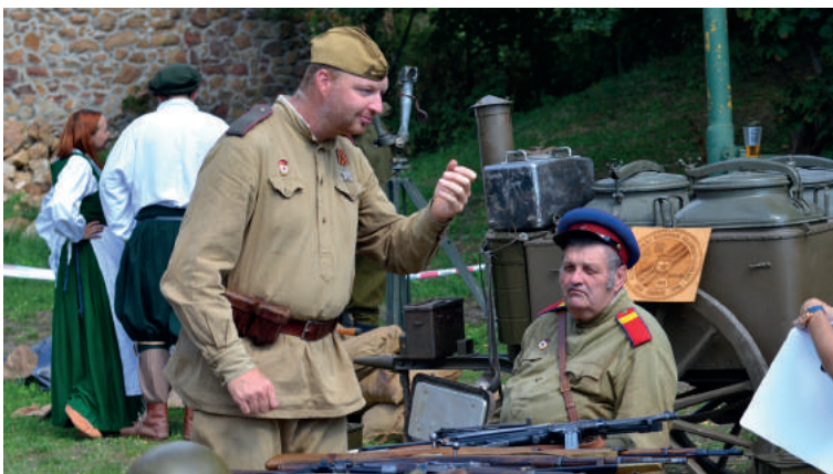
A második világháború időszaka a katonai alakulatok egyenruhái és haditechnikája révén került bemutatásra (Vörösgárdisták Hadtörténeli Klub).