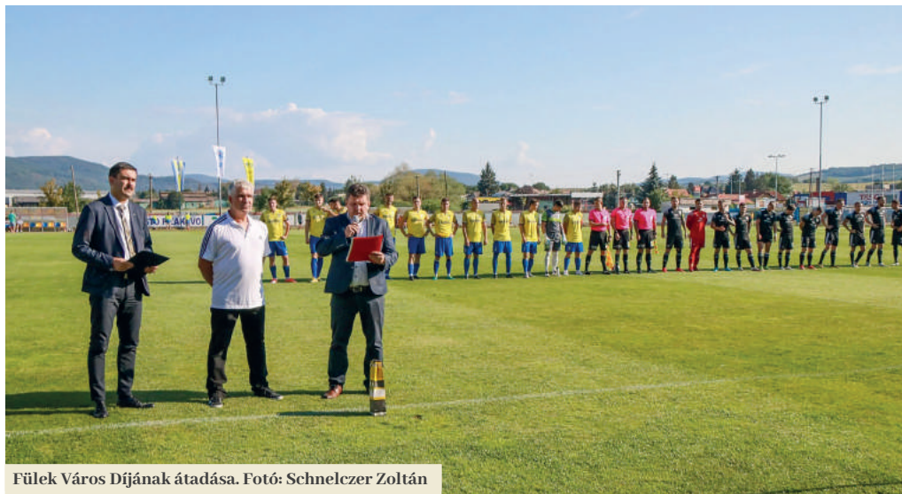
Füleki Város Díjának átadása.

Ez egy hosszútávú folyamat volt. Nem egyik