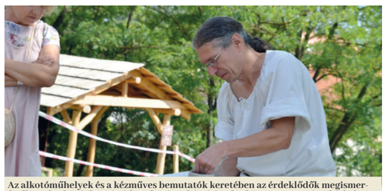
Az alkotóműhelyek és a kézműves bemutatók keretében az érdeklődők megismerkedhettek a középkori és újkori kerámiakészítéssel, a könyvnyomtatással, a keleti kávékultúrával, az arab írással, illetve oszmán miniatűrűt és török amulettet, ún. muszkát is készíthettek (Loydl Albert, Defensores, Hungari Dzsbedzsi).