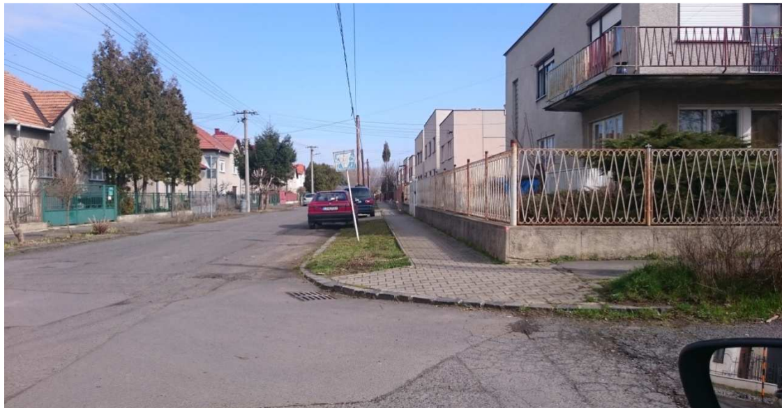
11. Fotografia – dopravná značka Slepá ulica v križovatke Kvetnej s Tulipánovou - zlá rozpoznateľnosť dopravnej značky v dôsledku straty farebnosti – premiestniť nový, nepotrebnú z Jesenského ulice (viď fotografiu č. 20);