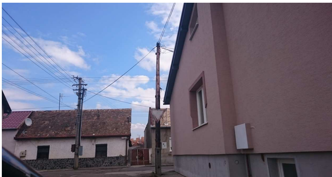
21. Fotografia – výjazd z Bernolákovej na B.S.Timravy - zlá rozpoznateľnosť dopravnej značky „Daj prednosť v jazde“ v dôsledky straty farebnosti – navrhujeme ju prefarbiť ;