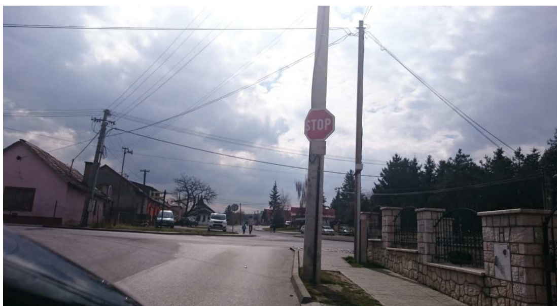
19. Fotografia – poškodená dopravná značka „Stoj, daj prednosť v jazde“ pri výjazde z Moyzesovej do križovatky s Hlavnou, Lučeneckou a kpt. Nálepku – navrhujeme vyrovnat' ohnutú časť dopravnej značky;