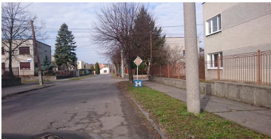
10. Fotografia – križovatka ulíc Kvetnej s Ružovou – dopravná značka Hlavná cesta so spadnutou dodatkovou tabuľou – navrhujeme ju uviesť do pôvodného stavu;