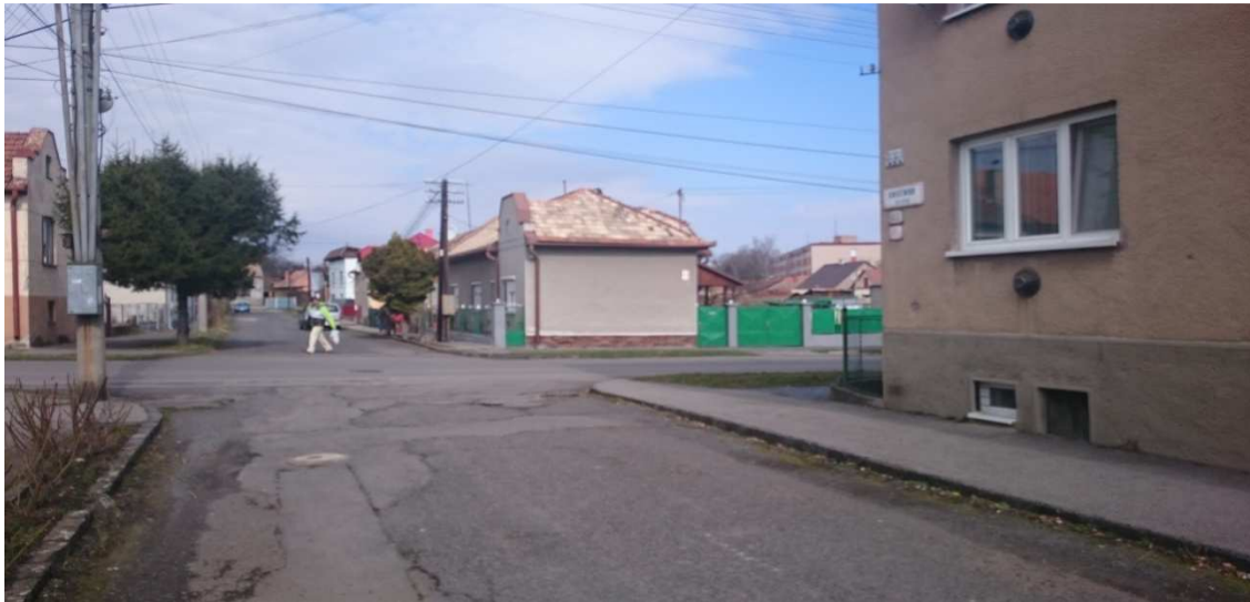
8. Fotografia – výjazd z Kukučínovej (pred vchodom do činžiaka č. 9) na Mládežnícku – navrhujeme urýchlene osadiť dopravnú značku „Daj prednosť v jazde“;