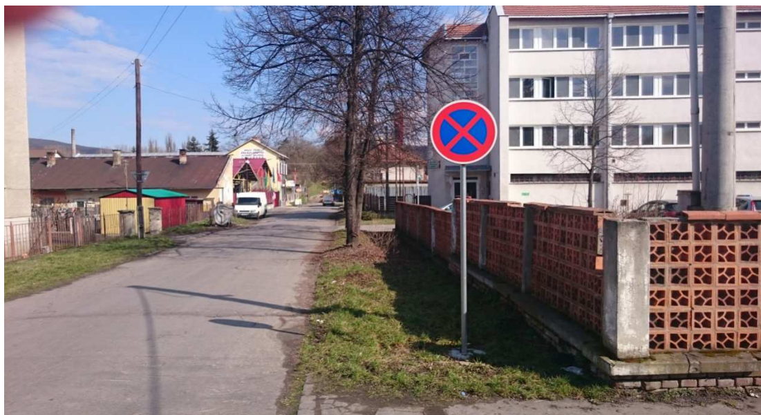
28. Fotografia – dopravná značka „Zákaz zastavenia“ pri vjazde z Biskupickej na Hurbanovú – navrhujeme doplniť dodatkovú tabuľu s úsekom platnosti 20 m;