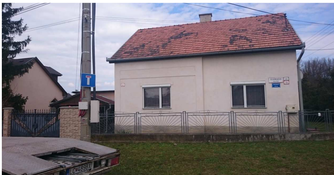
20. Fotografia – vjazd na Jesenského z Lučeneckej – dopravná značka „Slepá ulica“ neslúži účelu, ulica pokračuje a je spojená s Bernolákovou – navrhujeme značku demontovať a premiestniť ju na ulicu Tulipánovú (viď obrázok s textom č. 13);