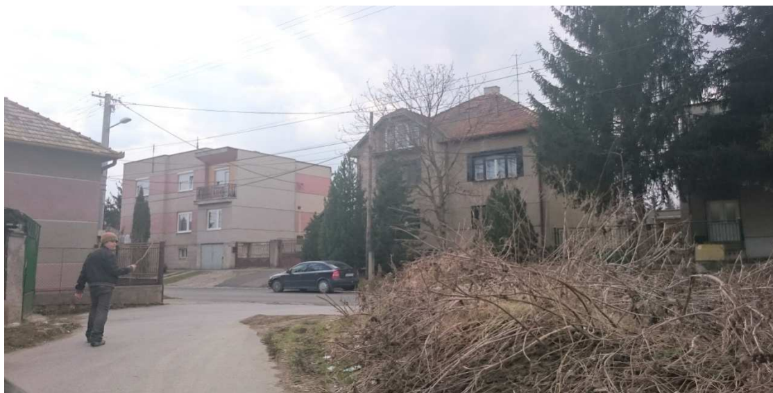
13. Fotografia – výjazd z 29. Augusta na ČSA – navrhujeme zvážiť potrebu osadenia dopravnej značky „Daj prednosť v jazde“ ;