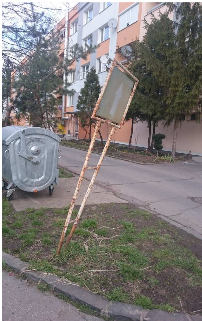
32. Fotografia – odbočka zo Štúrovej k MŠ v smere od ulici Mládežníckej – navrhujeme prefarbiť a napraviť stĺp vykrivenej značky „Prikázaný smer jazdy“;