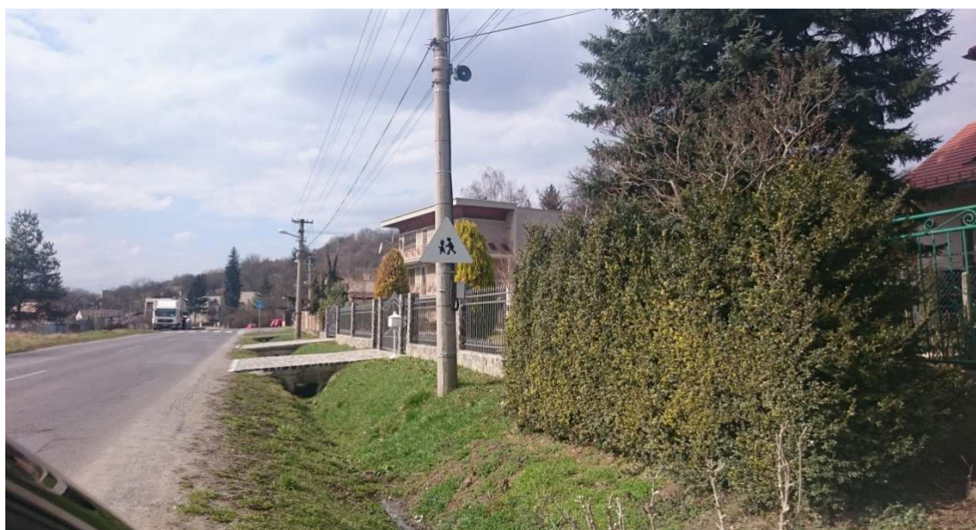
25. Fotografia – Mlynská zlá rozpoznateľnosť dopravnej značky „Pozor deti“ v dôsledky straty farebnosti – navrhujeme apelovať prostredníctvom dopravného inžiniera ODI Lučenec na správcu ciest o výmenu značky;