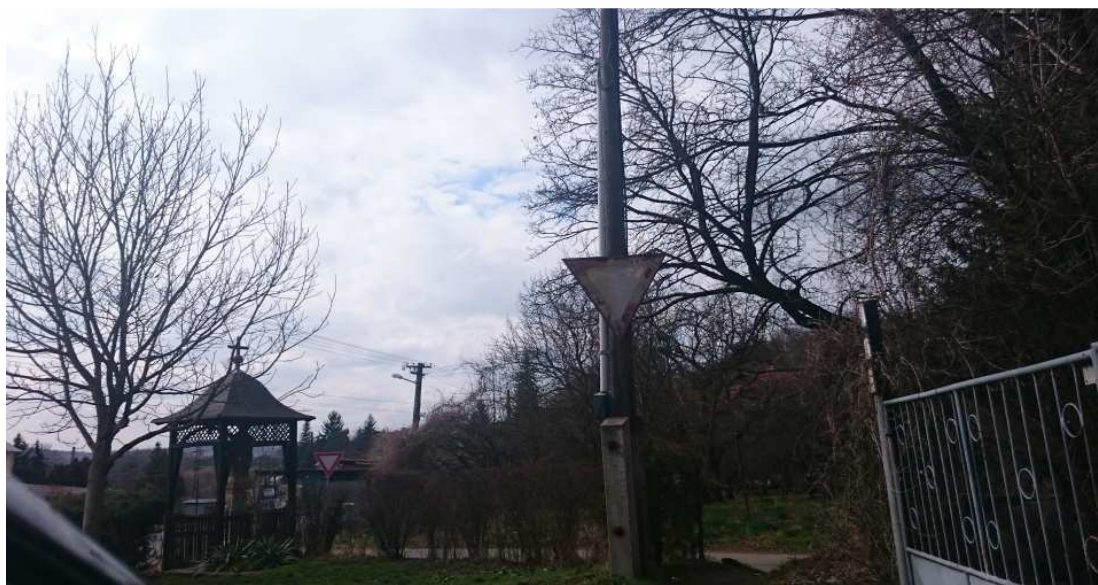
26. Fotografia – výjazd z Úzkej na Mlynskú zlá rozpoznateľnosť dopravnej značky „Daj prednosť v jazde“ v dôsledky straty farebnosti - navrhujeme ju prefarbiť ;