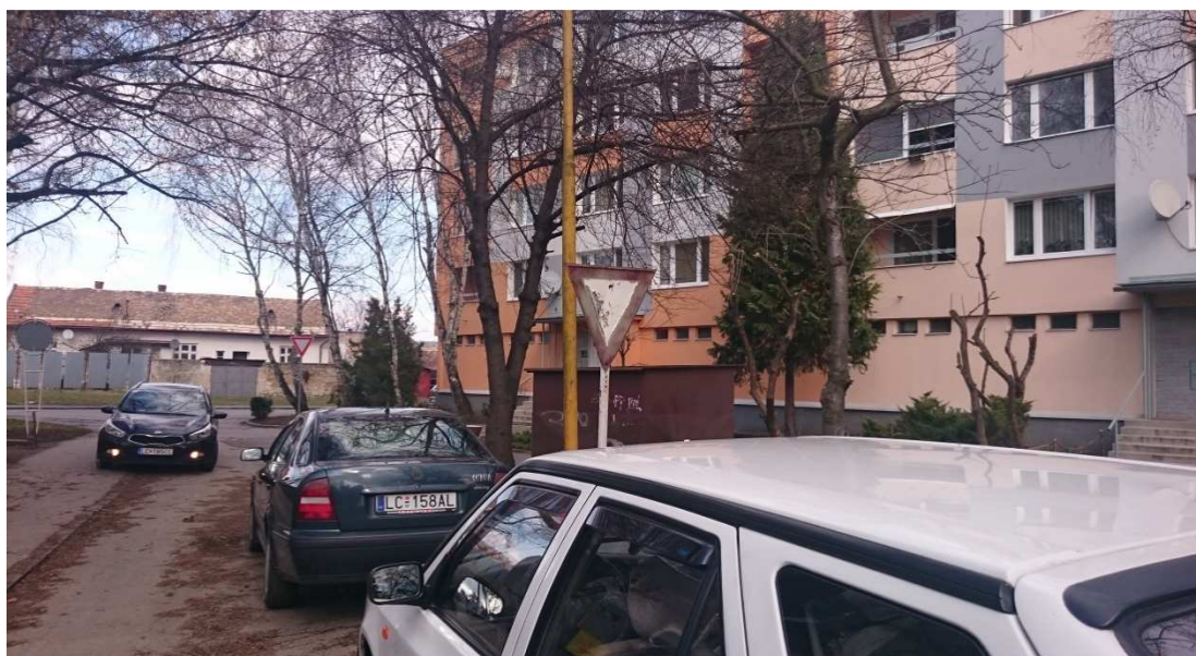
29-31. Fotografie – poškodené dopravné značky v križovatke ulíc Vajanského a Štúrovej – navrhujeme prefarbiť (prvú a tretiu značku), druhú očistiť od nápisov;