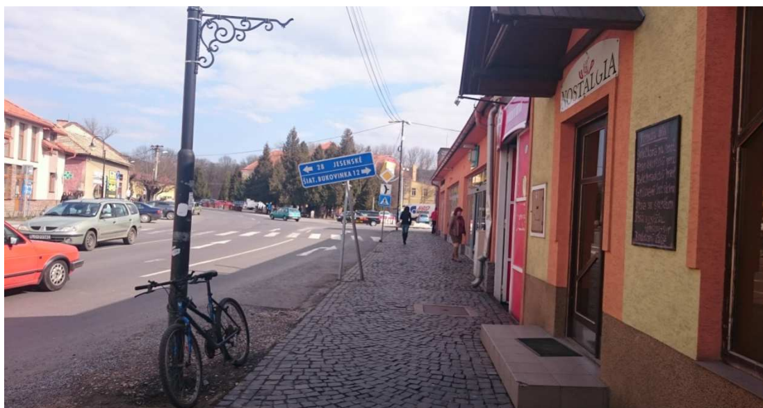
27. Fotografia – Na Hlavnej pred reštauráciou Nostalgia, poškodený, vykrivený stĺpik s dopravnou značkou - navrhujeme apelovať prostredníctvom dopravného inžiniera ODI Lučenec na správcu ciest o napravenie značky ;