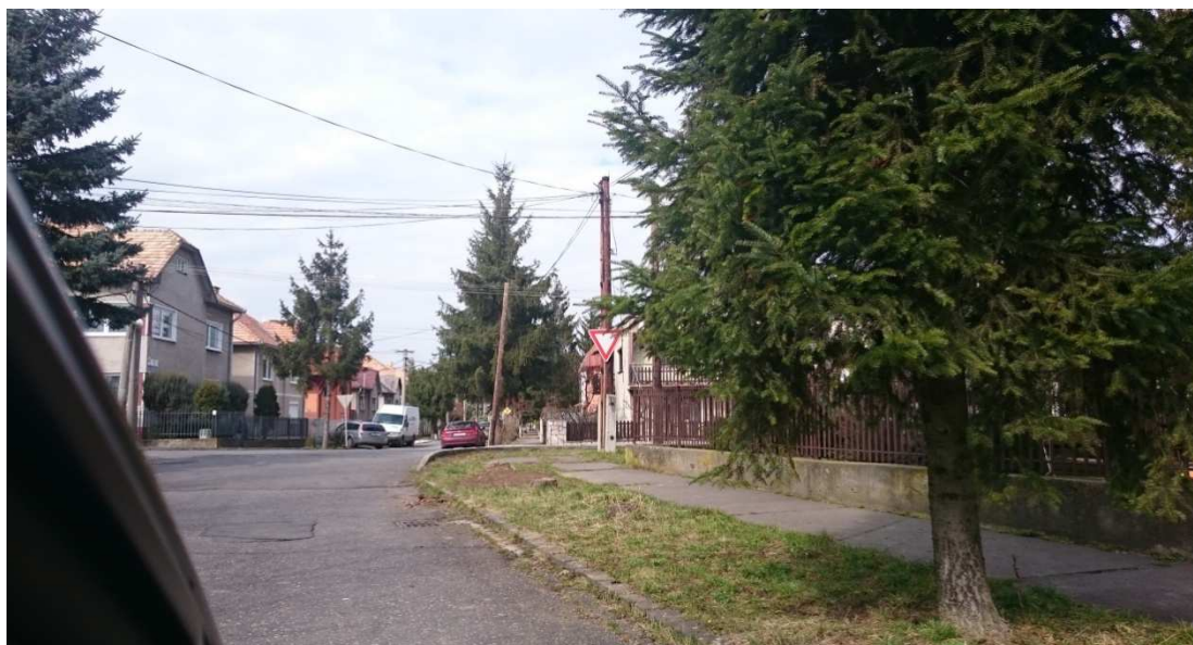
17-18. Fotografia – výjazd z B. Bartóka na Družstevnú – zakrytý výhľad na dopravnú značku „Daj prednosť v jazde“ – navrhujeme zrezať spodné konára stromu zakrývajúce značku;