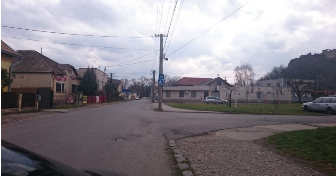
22. Fotografia – pri križovatke Daxnerovej s F. lúkou neplatné dopravné značky (odporúčaná rýchlosť ...) pred pohostinstvom Pumukli – navrhujeme ich demontovať ;