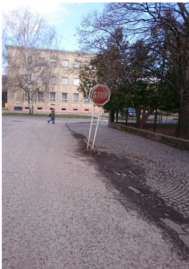
7. Fotografia – výjazd zo Školskej na Mládežnícku, vykrivená dopravná značka – navrhujeme ju napraviť, dať do zvislej polohy;