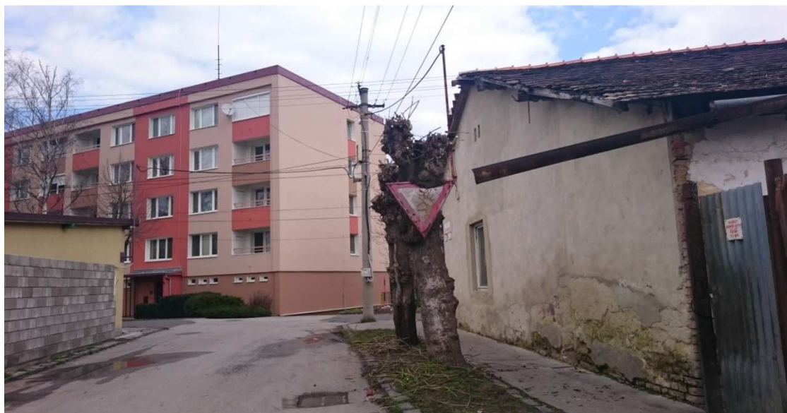
12. Fotografia – výjazd z 29. augusta na 1. Mája – navrhuje demontáž existujúcej a osadenie novej dopravnej značky (nezodpovedá vážnosti svojho účelu);