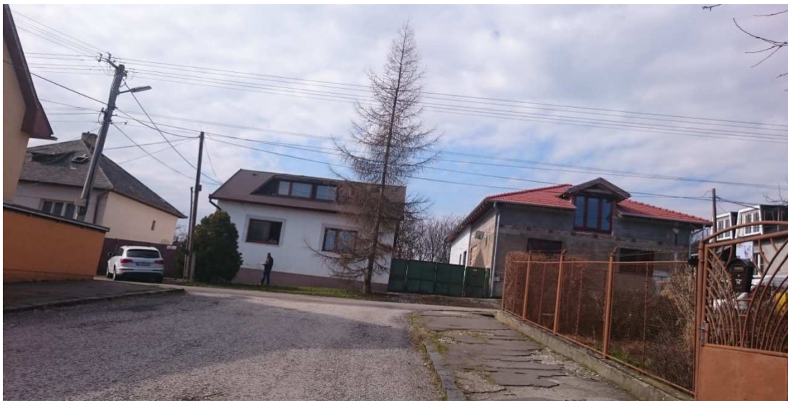
9. Fotografia – výjazd z ulice smerujúcej od 1. Mája na ČSA – navrhujeme osadiť dopravnú značku „Daj prednosť v jazde“;