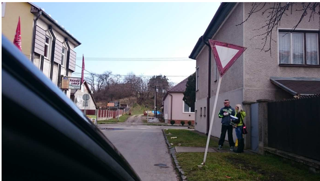
6. Fotografia – výjazd z Hurbanovej na Malocintorínsku – vykrivený stĺp dopravnej značky – navrhujeme ju napraviť, dať do zvislej polohy;