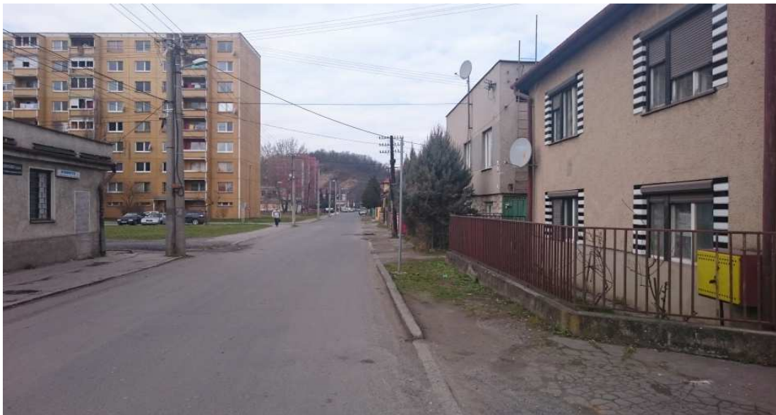
23. Fotografia – prázdny stĺpik (bez osadenej dopravnej značky) pred RD č. 8 na Daxnerovej – z dôvodu v blízkosti sa nachádzajúcich ZŠ a MŠ navrhujeme využiť na osadenie dopravnej značky „Pozor detí“ spolu so značkou obmedzujúcou rýchlosť na danom úseku;