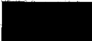
Pečiatka a podpis poistníka

V O FILVARKOVE 15.07.2011. Centrum voľného času TUVENES TU